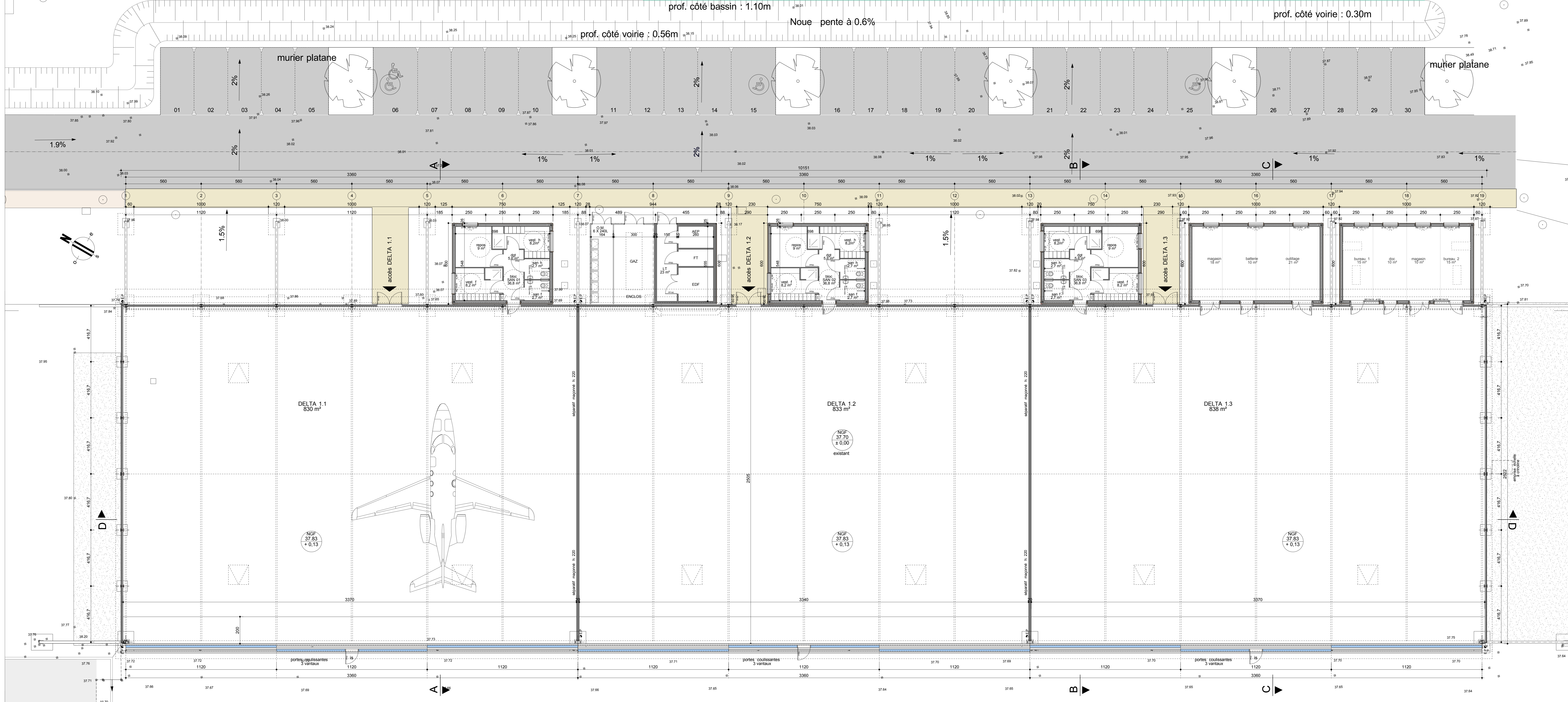
plan rez-de-chaussée éch: 1/100°